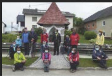
Ahrntal - von Kasern am Lausitzerweg zur Birnluckenhütte (2441m)