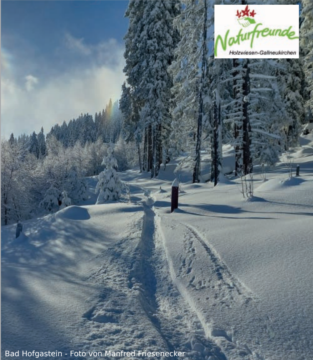
Bad Hofgastein